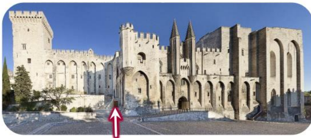
Entrée du Centre des Congrès